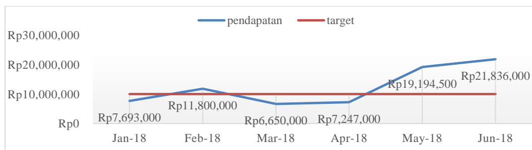
Gambar 1 Target dan Realisasi Penjualan 2018 Kerrong Batik

Salah satu cara yang dilakukan Kerrong Batik untuk memasarkan produknya secara langsung ke konsumen adaah dengan mengikuti event seperti pameran di acara reuni sekolah. Pameran tersebut, yang merupakan aktivitas promosi yang dilakukan Kerrong Batik, disambut positif oleh panitia dan pengunjung pameran.