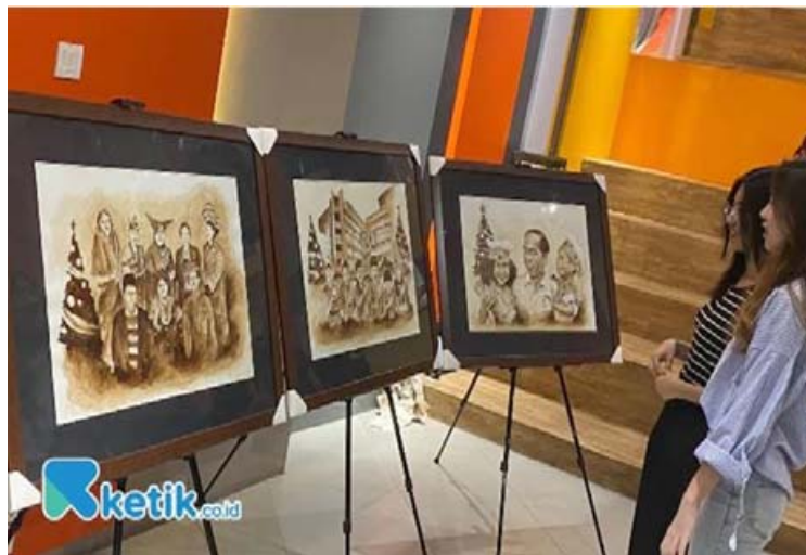
Gambar 6 Lukisan dari Residu Kopi

gaman yang memiliki arti kaya dan berbeda akan menghidupkan demokrasi. Toleransi sangat penting untuk membawa kedamaian dari perbedaan (Gambar 6).