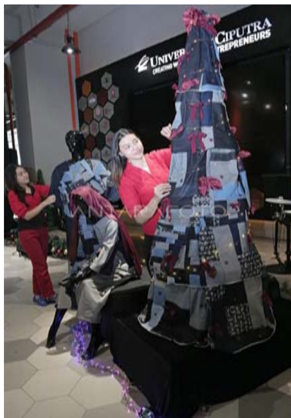
Gambar 7 Pohon Natal dan Busana Berbahan Limbah

Dalam menyambut natal dan tahun baru yang barusan saja kita lalui maka masih juga terpampang pohon natal yang merupakan kreasi pohon natal dan busana berbahan limbah kain