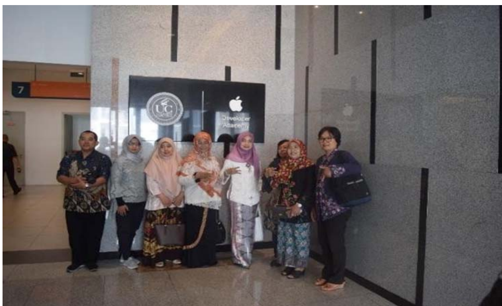
Gambar 2 Depan Logo Apple Academic Support