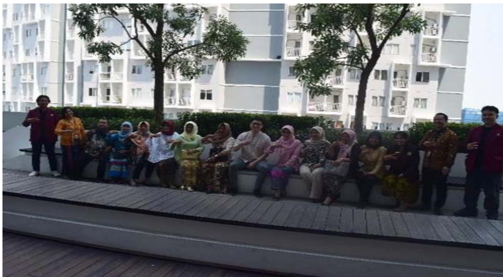
Gambar 3 Outdoor Apple Academic Support

Ciputra yang bertekad untuk memperkuat ekonomi Indonesia dengan mengembangkan para pengembang kelas dunia. Program Apple Developer Academy hanya ada dua di Indonesia, yang salah satunya di Universitas Ciputra. Akademi ini bertujuan memberikan pelatihan dan pengetahuan kepada para pengusaha, desainer, dan pengembang untuk mengejar karir seputar aplikasi iOS.