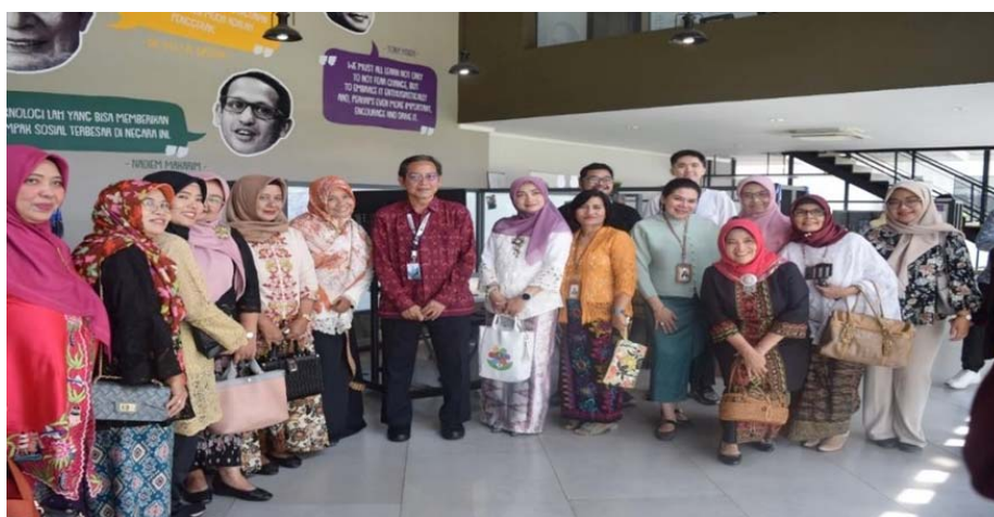
Gambar 5 Foto Bersama di UC Venture

Ada banyak karya menarik dari kampus UC yang biasanya ditempatkan pada Copereneur. Karya yang ditampilkan berganti-ganti dan disesuaikan dengan momen atau tren yang sedang berlangsung di tanah air. Pada saat ini karya yang ditampilkan adalah yang bertujuan untuk mendorong rasa perdamaian di pesta demokrasi, pemilu yang akan diadakan pada bulan Februari 2024. Adanya lukisan yang bertemakan “Pesta Demokrasi 2024” berlangsung meriah namun tetap dengan perdamaian antarumat beragama maupun suku bangsa. Pesan yang ingin disampaikan dalam karya tersebut adalah kebera-