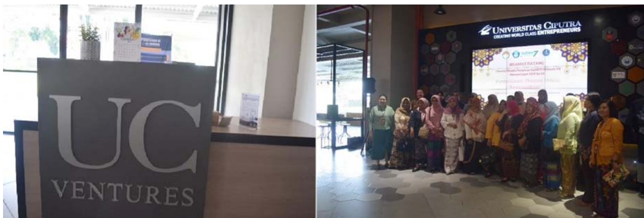
Gambar 4 UC Venture

siswa dan alumni. UC Ventures memiliki tiga pilar utama meliputi UC Ventures Community, UC Ventures Training and Incubation Program, dan UC Ventures Facility Center. Salah satu bagian dari pusat fasilitas yang ada dan menjadi fokus perhatian pada tanggal 11 November 2021 adalah Ventures Lab.