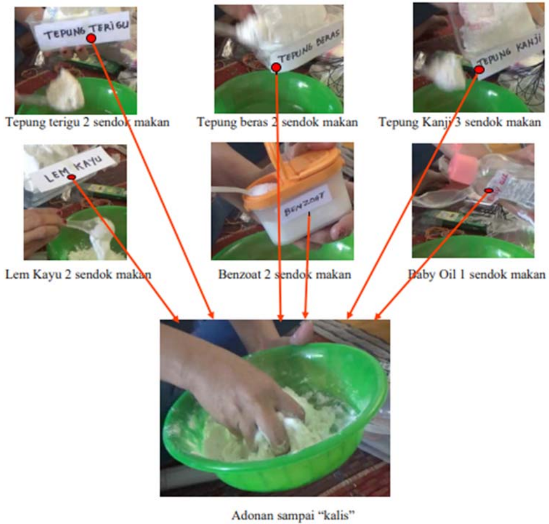
Gambar 2 Proses Pembuatan Gantungan Kunci dengan Bahan Baku Clay