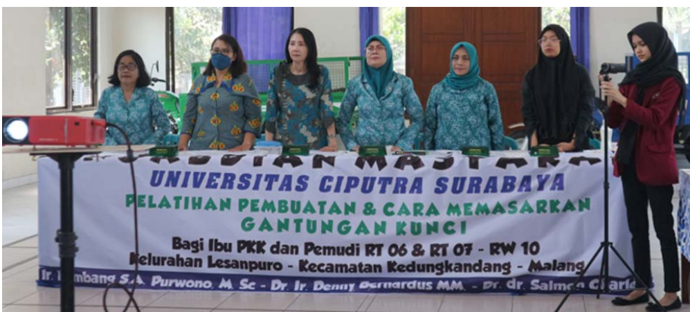
Gambar 6 Para Peserta Pelatihan pembuatan Gantungan Kunci