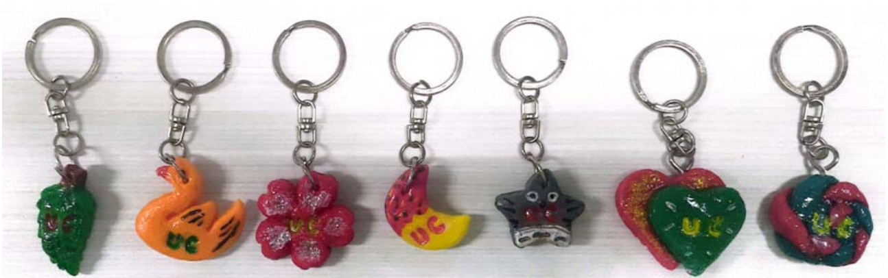
Gambar 3 Variasi Bentuk Gantungan Kunci