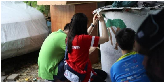
Gambar 5 Proses Mewarnai Hasil Sketch Drawing

bercerita tentang gambar yang sudah kita gambar di kolam lele tersebut, lalu mengajak mereka secara bersama-sama untuk memilih warna yang cocok untuk pemandangan tersebut. Kami menyiapkan warna-warna yang dibutuhkan, antara lain hijau, hitam, biru, kuning, dan coklat. Setelah itu kami mulai meng-