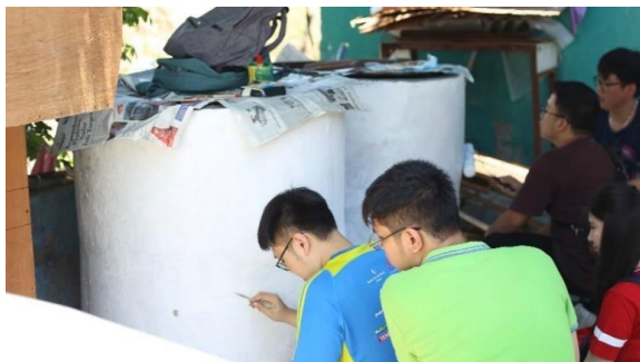
Gambar 4 Proses Menggambar Sketch Drawing Kolam Lele

kami, Mahasiswa Universitas Kristen Petra menggambar sketch drawing untuk memperindah kolam lele tersebut, kelompok saya menggambar sebuah kolam, dikelilingi batu-batuan, pohon-pohon dan juga sebuah jembatan burung-burung terbang dengan langit senja. Lalu setelah gambar selesai dibuat, kami mulai berinteraksi dengan anak kecil, mula-mula kami