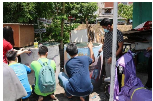
Gambar 3: Pengampelasan Kolam Lele