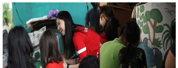
Gambar 6 Kami Bersama Anak-Anak Mewarnai Kolam Lele

bercerita tentang gambar yang sudah kita gambar di kolam lele tersebut, lalu mengajak mereka secara bersama-sama untuk memilih warna yang cocok untuk pemandangan tersebut. Kami menyiapkan warna-warna yang dibutuhkan, antara lain hijau, hitam, biru, kuning, dan coklat. Setelah itu kami mulai meng-