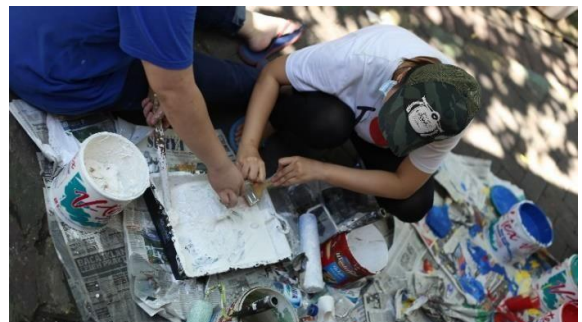
Gambar 2: Persiapan Bahan untuk Mengencerkan Cat

Setelah melihat kondisi kolam lele, kami melakukan pengampelasan untuk memperhalus permukaan kolam (Gambar 3) dan mengecat warna putih sebagai warna dasar dari kolam tersebut.