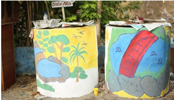
Gambar 7 Hasil Menghias Kolam Ikan Lele

pada hari berikutnya (Gambar 4- Gambar 8)