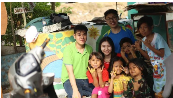
Gambar 8 Foto Bersama Kami Setelah Selesai Menghias Kolam Lele