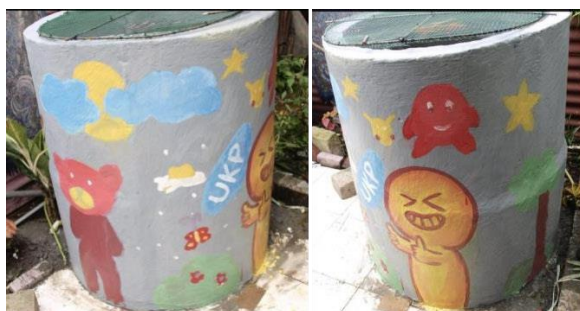
Gambar 1 Lokasi Dua Kolam Lele yang akan Dihias

Perencanaan awal penghiasan kolam budidaya lele adalah dengan melihat kondisi kolam lele yang sudah tersedia (Gambar 1) dan mempersiapkan bahan-bahan yang diperlukan (Gambar 2). Kolam lele yang akan dihias berjumlah 4, dengan ukuran diameter 1 m dan tinggi 1 m. Bahan-bahan yang dibutuhkan dan dipersiapkan untuk 1 kolam lele adalah kuas beberapa ukuran, cat berwarna merah, biru serta kuning, dan air (jumlah air disesuaikan dengan kebutuhan kekentalan cat) Selain itu kami juga menyiapkan komponen utamanya yaitu ikan lele.