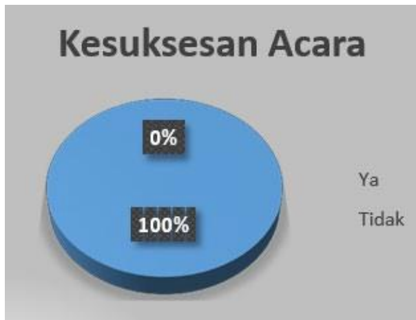
Diagram 2 Kesuksesan Acara

Menurut warga sekitar, acara ini sukses 100% seperti yang ditunjukkan oleh Diagram 2.