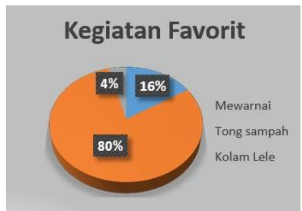
Diagram 3 Kegiatan yang Disukai Warga

Sedangkan dari Diagram 3 dapat dilihat bahwa ada 4% warga yang menyukai kegiatan membuat kolam ikan lele ini, 16% warga menyukai kegiatan lomba mewarnai yang diadakan serta sebagian besar warga yaitu sebesar 80% menyukai kegiatan lomba mengecat tong sampah.