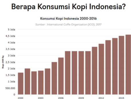
Gambar 1. Pertumbuhan Konsumsi Kopi di Indonesia

Perkembangan penggabungan kedai kopi dan coworking space juga menjadikan suatu potensi bisnis yang baru dan juga efisien secara waktu (Geniusidea, 2018).