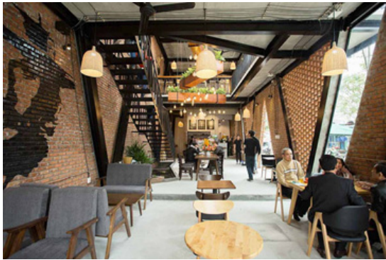
Gambar 4. Ilustrasi Coffe Shop yang dapat digunakan tempat bekerja

tertentu dan juga penyediaan ruangan kantor tersendiri yang bersifat privat dan tidak terganggu kebisingan dari luar. Coffe Shop juga dapat menyediakan area pembatasan bagi area privat dan non privat dimana coffee shop adalah non privat yang konsepnya lebih mengarah kepada relaksasi, hangout dan istirahat, tempat meeting dalam waktu yang singkat dan berskala kecil (tidak terlalu banyak orang), serta tempat yang menjadi ikonik untuk berfoto dan sebagainya.