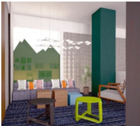
Gambar 4. Break Area

Agar ruangan-ruangan kantor mendapat cahaya yang cukup, sebagian penulis menerapkan penggunaan partisi kaca dan stiker sandblast dengan maksud privasi dalam tiap-tiap ruang terjaga. Selain menggunakan material-material yang sudah dibahas, material glass block juga diterapkan pada partisi dinding kantor. Glass block memiliki sifat yang mampu menyerap dan memberi cahaya, serta menambah nilai estetika dalam ruangan.