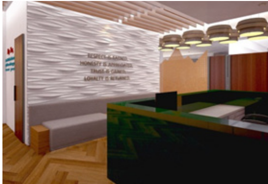
Gambar 3. Desain Lobby