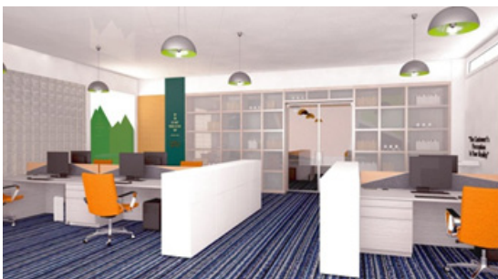
Gambar 7. Desain Ruang Kerja Karyawan