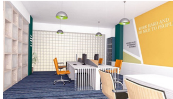
Gambar 5. Desain Ruang Kerja Karyawan

Agar ruangan-ruangan kantor mendapat cahaya yang cukup, sebagian penulis menerapkan penggunaan partisi kaca dan stiker sandblast dengan maksud privasi dalam tiap-tiap ruang terjaga. Selain menggunakan material-material yang sudah dibahas, material glass block juga diterapkan pada partisi dinding kantor. Glass block memiliki sifat yang mampu menyerap dan memberi cahaya, serta menambah nilai estetika dalam ruangan.