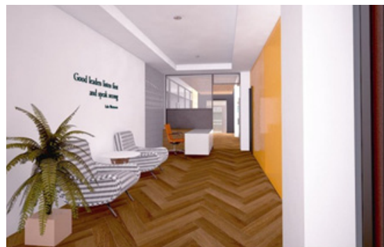
Gambar 6. Desain Lobby

Pada perancangan ini, juga diterapkan kata-kata motivasi yang menjadikan kantor ini sebagai inspirasi bagi pengguna. Menurut Mc. Donald, suatu perubahan energi di dalam pribadi seseorang yang ditandai dengan timbulnya afektif dan reaksi untuk mengantisipasi tercapainya tujuan. Kata-kata motivasi ini diletakkan strategis pada dinding-dinding kantor.