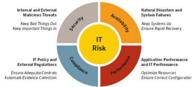
Gambar 1: Klasifikasi Risiko (Farber, 2008)

Berbeda dengan Jakaria, Dirgahayu, dan Hendrik (2013) yang mengklasifikasikan hanya menjadi 2 jenis risiko berdasarkan kerusakan, Farber (2008) mengklasifikasikan berdasarkan jenis serangan dan risiko yang ada. Gambar 1 di bawah ini menunjukkan klasifikasi risiko dari Teknologi Informasi: