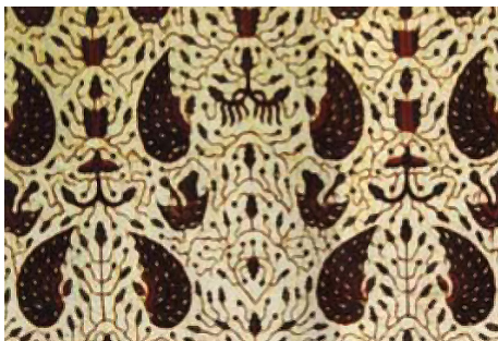
Gambar 3. Batik Motif Sido Asih