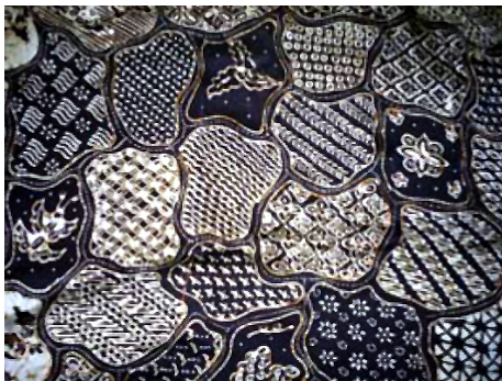
Gambar 1. Batik Motif Sekar Jagad , diakses dari https://images.app.goo.gl/HiB9DKPZSLAMuUMJ9

juga para ahli pembatik dalam keratonlah yang telah menciptakan motif ini, zaman dahulu batik keraton hanya boleh dipakai oleh Sultan dan keluarganya saja. Tetapi saat ini batik sudah bebas digunakan oleh siapapun, batik keraton ini memiliki filosofi dan makna yang hidup.