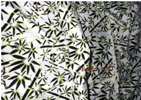
Gambar 2. Batik Motif Sidomukti Magetan