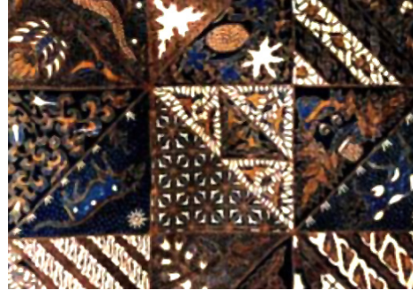
Gambar 4. Batik Motif Tambal , diakses dari https://images.app.goo.gl/7n1HkWxKTPZKDfCF9